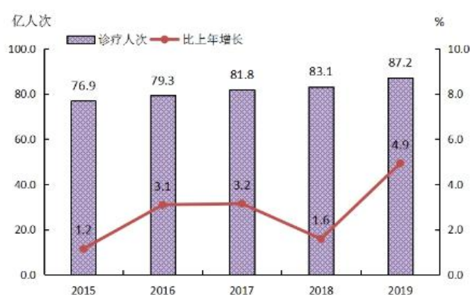
图4 全国医疗卫生机构门诊量及增长速度

2019年公立医院诊疗人次32.7亿人次（占医院总数的85.2%），民营医院5.7亿人次（占医院总数的14.8%）（见表4）。