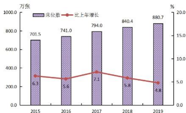
图2 全国医疗卫生机构床位及增长速度

3. 卫生人员总数。2019年末，全国卫生人员总数达1292.8万人，比上年增加62.8万人（增长5.1%）。